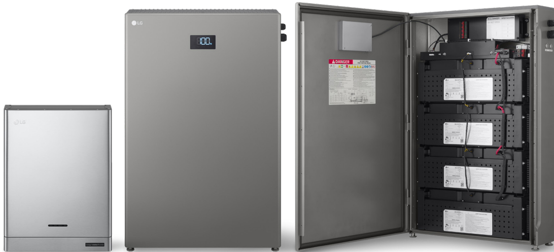
LG ESS Home 8 | 10 D008KE1N211 D010KE1N211

Das LG Electronics ESS ist ein modernes Home Energy System für Hausbesitzer, die Ihren Energieverbrauch zu Hause stets unter Kontrolle haben möchten. Es stellt Tag und Nacht zuverlässig Strom aus einem hocheffizienten System bereit. Dank seiner modularen Konzeption lässt sich die nutzbare Kapazität der Batterie ohne zusätzliche Geräte bis auf 28,5 kWh erweitern.